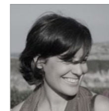
Zaloa Mayor RAFAEL DE-LA HOZ ARQUITECTOS www.rafaeldelahoz.com