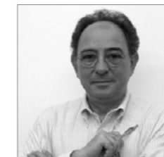
Carlos Rubio RUBIO ARQUITECTURA www.rubioarquitectura.com