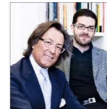
Julio Touza TOUZA ARQUITECTOS www.touza.com