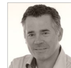
Mikel Barriola CHAPMAN TAYLOR www.chapmantaylor.com