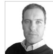
Juan Ramírez OPTA ARQUITECTOS www.optaarquitectos.com