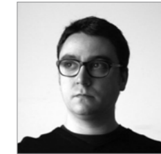
Ricardo Montoro ALLENDE ARQUITECTOS www.allendearquitectos.com