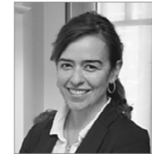
Verónica Durán ESTUDIO VERÓNICA DURÁN www.estudioveronicaduran.com